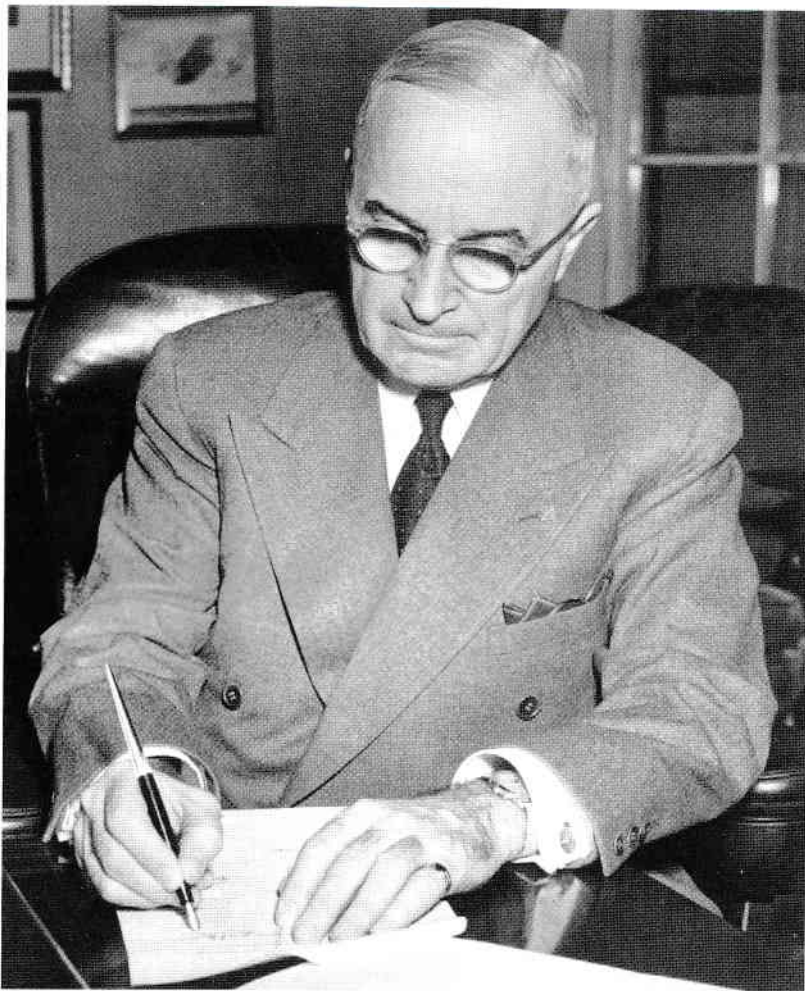
Harry S. Truman a preluat președinția având foarte multe de învățat.

Propagandiștii din Vest făcuseră tot posibilul pentru a crea entuziasm în ceea ce privește alianța cu sovieticii pe tot parcursul războiului, dar nimeni nu trăia cu iluzia că relația ar fi fost ceva mai mult decât o căsătorie din interes. Prăpastia ideologică dintre nașiști și comuniștii sovietici era, desigur, enormă, însă alegerea între două forme diferite de totalitarism nu putea avea sorti de izbândă. Hitler reprezenta un pericol imediat, astfel că o înțelegere cu Uniunea Sovietică fusese absolut necesară; aceasta însă nu elimina pericolul reprezentat de atitudinea imprevizibilă a URSS după terminarea războiului.